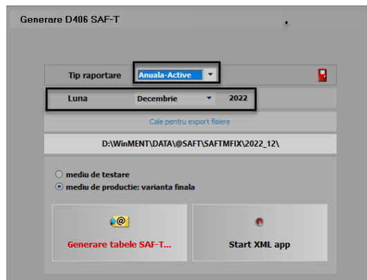
Generarea declarației anuale pentru mijloace fixe

Pentru generarea declarației pentru mijloace fixe se va folosi opțiunea Anuala-Active , disponibilă în modulul D406 din executabilul Declarații , fiind poziționați pe luna decembrie a anului pentru care se face raportarea, pe luna închisă.